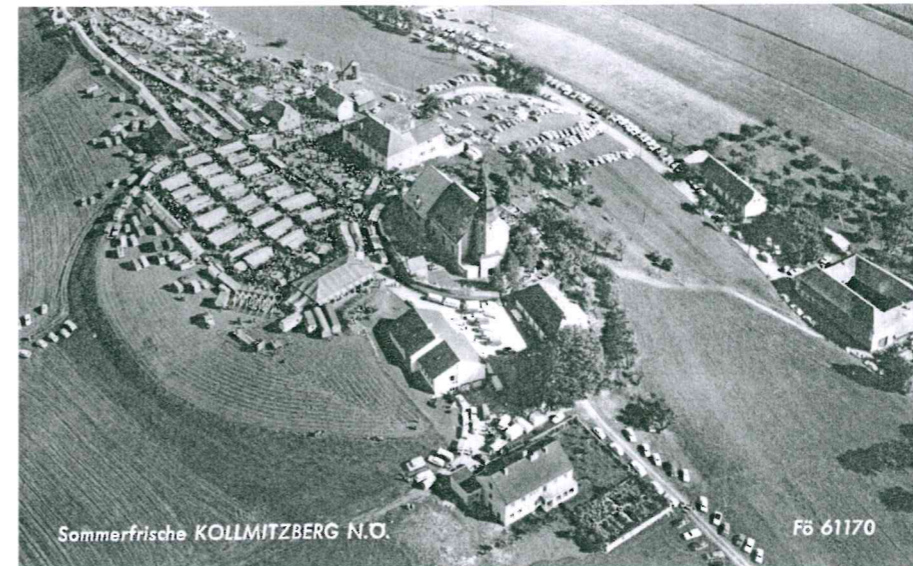
Sommerfrische KOLLMITZBERG N.O.

Der Kirtag dauerte – wie auch heute noch – zwei Tage. Doch wo haben die zahlreichen Pilger übernachtet? Wer nicht in umliegenden Bauernhöfen, Hütten und Scheunen Aufnahme fand oder die Nacht im Freien verbringen wollte, der schlug sein Quartier in der Kirche auf! Dies erregte verständlicherweise das Misstrauen der kirchlichen Behörden. So erstattete im Jahr 1777 der zuständige Dechant von Enns seinem geistlichen Oberhirten, dem Passauer Bischof, eine Anzeige, in welcher es heißt: „... daß die Leute großen theils in der Kirchen übernachteten, das Gotteshaus einer Casernen gleich machen, da männ- und weibliches Geschlecht vermischet liegen und lehnen. Wie große Gelegenheit