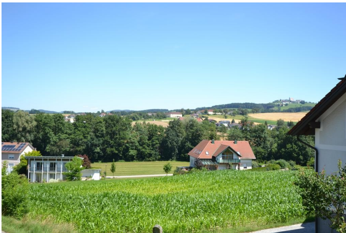
Blick zum Kollnitzberg