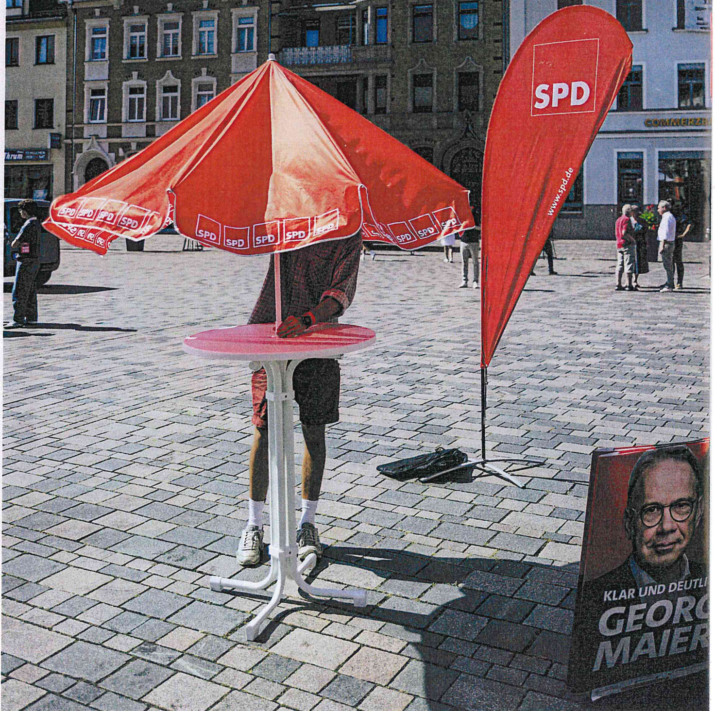
SPD-Infostand im thüringischen Schleiz: Falsche Strategie?